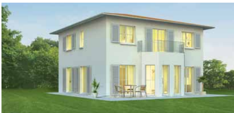
Haus «Limette Zelt Dach» 150m 2 , 5½ Zimmer, 3 Nasszellen